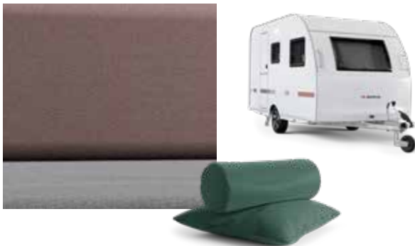
MAUVE DAMASK OPTION