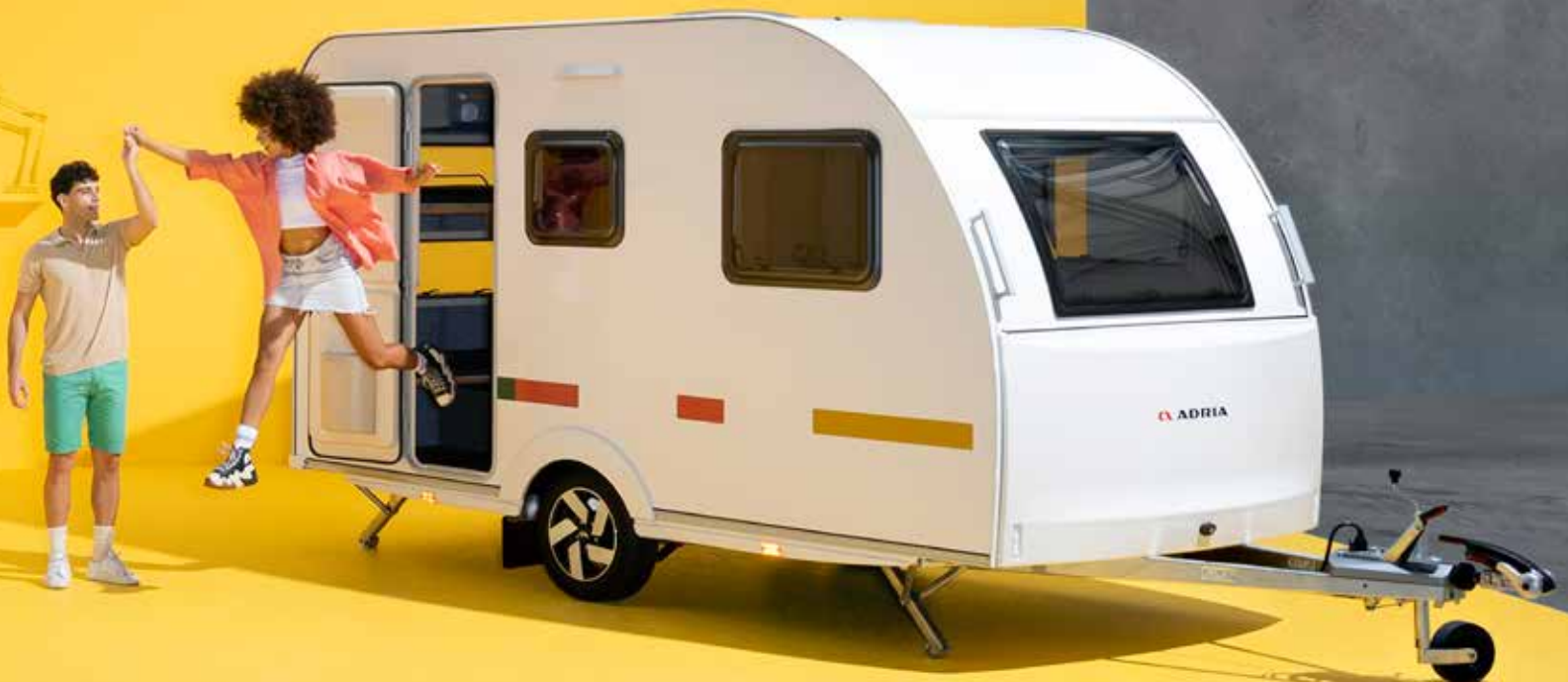
Abbildung zeigt AVIVA LITE 360 DK mit optionalen 14" Leichtmetallfelgen.

EIN LEICHTER UND KREATIVER WOHNWAGEN. VOLLWERTIG, FLEXIBEL UND GLEICHZEITIG AUF DAS WESENTLICHE REDUZIERT.