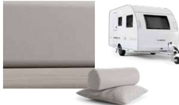
TOFFEE TWEED OPTION