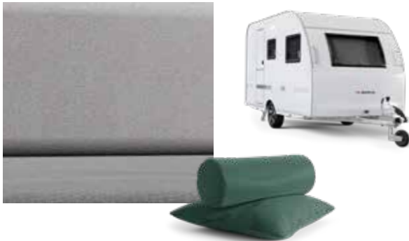
SILVER ASH SERIE